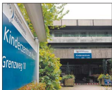
In der Kinderklinik Bethel wurde das Baby erfolgreich operiert.

Gegen den Vater ermittelt die Polizei wegen Verdachts der Kindesmisshandlung und der Kindesentziehung.